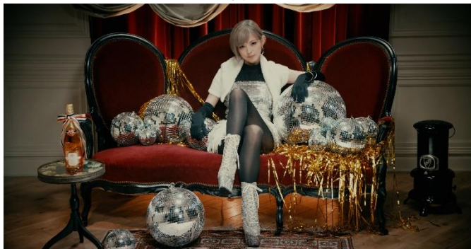
▼80'sディスコ×オパークダイヤ柄