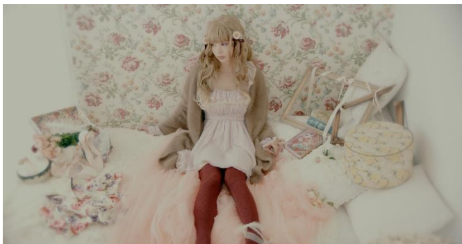
▼あまかわメルヘン×杳リブ柄カラータイツ