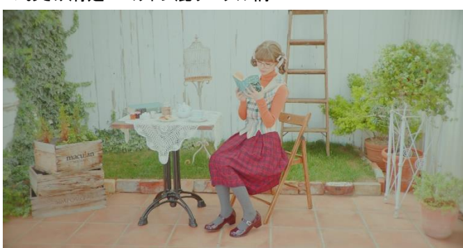
▼おさげ清楚×コットン混ケーブル柄