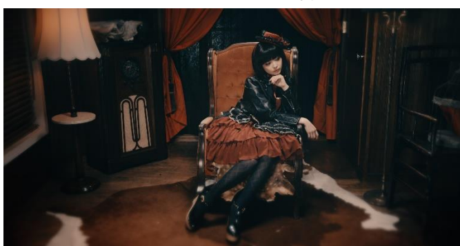
▼パンキッシュ・ゴスロリ×スパイラルダイヤ柄