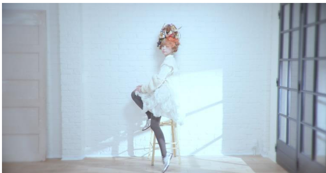
▼ハイファッション×コットン混ダイヤ柄