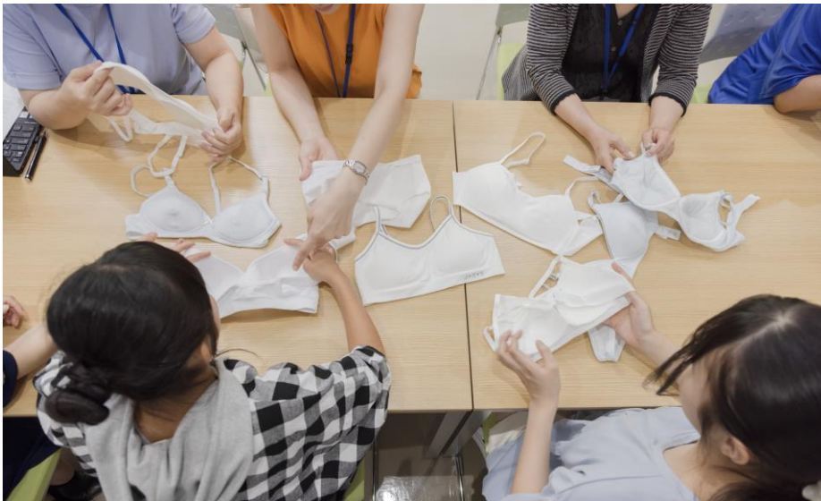
インターネットによる定量調査で把握したデザイン・素材・機能の最新ニーズをもとに試作品を製作し、小学6年生から中学2年生までの女の子にグループインタビューを実施。

アツギ株式会社（本社：神奈川県海老名市、代表取締役社長：日光信二）は、ジュニアブラのロングセラーブランド「Hijuni/ハイジュニ」のうち、ファーストブラとして定評のあるベーシックラインを全面リニューアルしました。リニューアルにあたって、アツギでは小学4年生から高校3年生までを対象としたインターネット調査を実施し、デザイン・素材・機能の最新ニーズを把握したうえで、これをもとにグループインタビューを実施。子どもの生の声を反映したハイジュニベーシックラインはスーパーマーケット、衣料品専門店、アツギオンラインショップで好評発売中です。