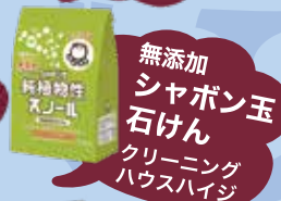
無添加 シャボン玉 石けん クリーニング ハウスハイジ