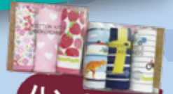
ハンカチほか ブルーミング中西株式会社