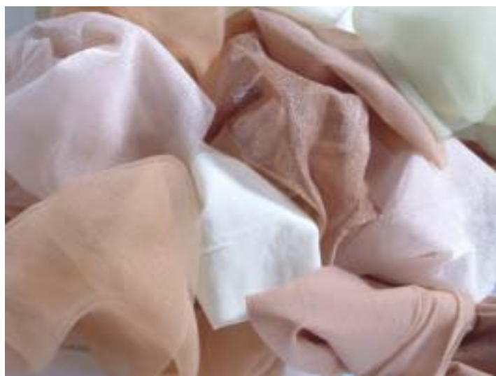
図 1.3 タイプそれぞれの編地の写真

新シリーズはそれぞれ‘GLOSS TOUCH(グロスタッチ)’‘BEAUTY CONTRAST(ビューティコントラスト)’‘NUDIE NATURAL(ヌーディナチュラル)’という品名で、脚をより美しく見せるための‘ベースメイク’機能がその主な役割です。その役割に加えて美しい白い脚の維持のために現存する美白成分の中では効果が高いとされる天然美白成分エラグ酸を付着加工し、脚肌の質感演出とスキンケアの両方を意識した商品企画です。