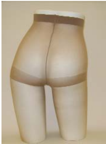
リニューアルタイプ