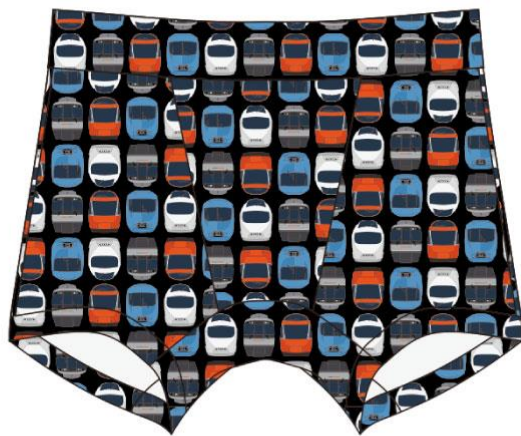
小田急電鉄商品化許諾済

NINJAPANTS（ニンジャパンツ）は、2020年春夏からアツギが発売しているインナーウェアブランドです。